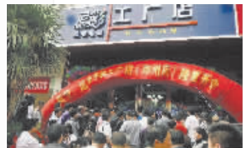
郑州工厂店已于4月10日开业 欢迎您亲临现场体验