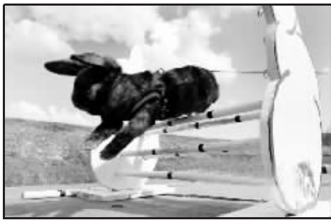
不管黑白兔,抢先撞线就是好兔