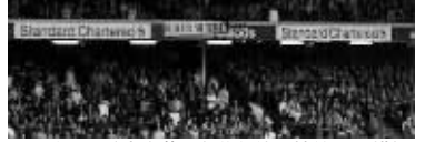
2011年,曼联球迷潜入安菲尔德悬挂第19冠横幅