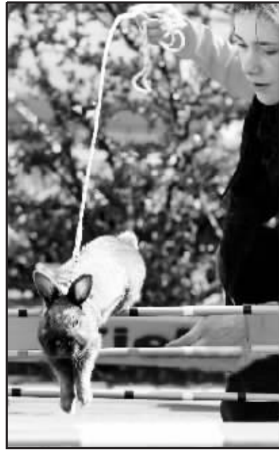
起跑有点慢,节奏有点乱