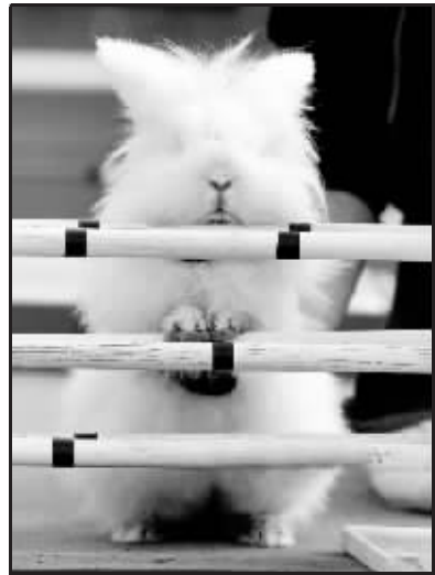
这位同学,该醒醒了,乌龟追上了