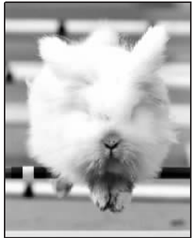
兔兔赛跑是传说,我在做梦吃火锅