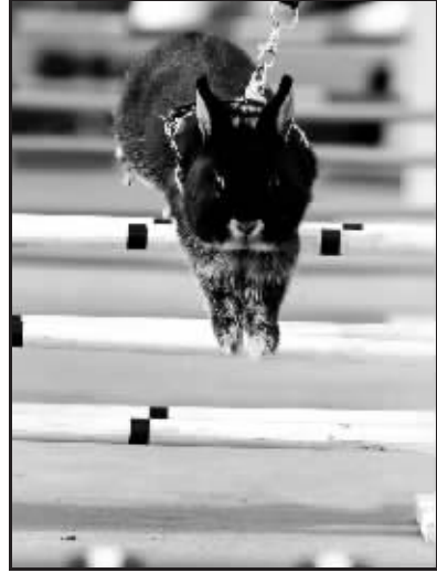
哥有和奥利弗一样的健美肤色