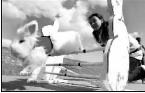
七步上栏,我一兔当先