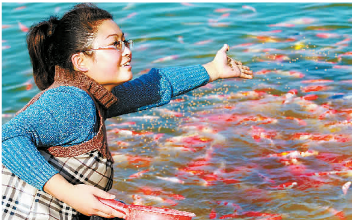
10月8日，工作人员在为锦鲤鱼投料。利用镇平县起河岸边河滩地，南阳市长江渔人实业有限公司投资7000多万元建成高标准观赏鱼养殖池800余亩，并采用日本技术建成锦鲤鱼孵化场，成功孵化出幼苗1亿多尾。目前，镇平已成为我省最大的锦鲤生产基地。③3