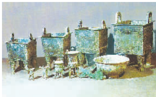
南顺城街窖藏坑出土的青铜器

规模最大、类型最为完整的古代城市遗址。郑州商城傍水而建的生态理念、科学规范的城区布局、坚固严密的城防体系、方便完善的生活设施、雄伟庄严的宫殿建筑，开辟了王都营建模式的先河，成为世界早期文明阶段最为重要的城市之一。