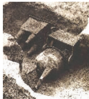
向阳食品厂窖藏坑