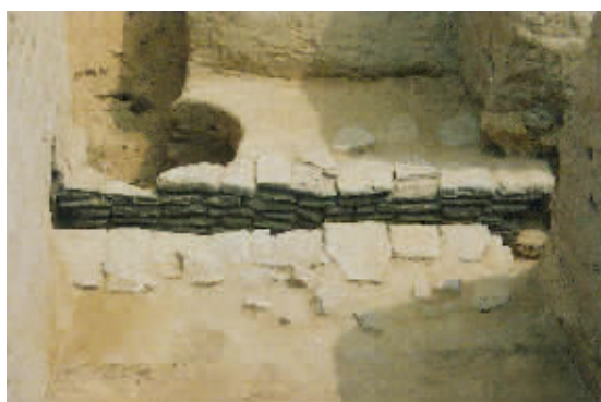
商城遗址宫城区输水设施

古都郑州，不仅开创了中国城市发展史，它还是当今世界城市群中年龄最长的城市，自 3600 年前在现址筑城时起，城区就再未迁移他处，传承沿袭从未间断，至今已发展成为拥有 800 多万人口的区域性大都市。其交通运输、物流商贸、工业制造、文化旅游等在全国