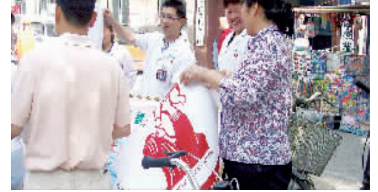
近日,郑州市中医院作为郑州市唯一冠名的红十字会联合郑州市红十字会、郑州市妇联共同主办了“文化助残 放飞梦想”大型捐助活动。郑州市中医院干部职工慷慨解囊、奉献爱心,为孤残儿童捐款24717元,捐赠图书、作业本、书包等爱心物品695件,用自己的爱心点亮了孤残儿童的节日梦想。(王红专)