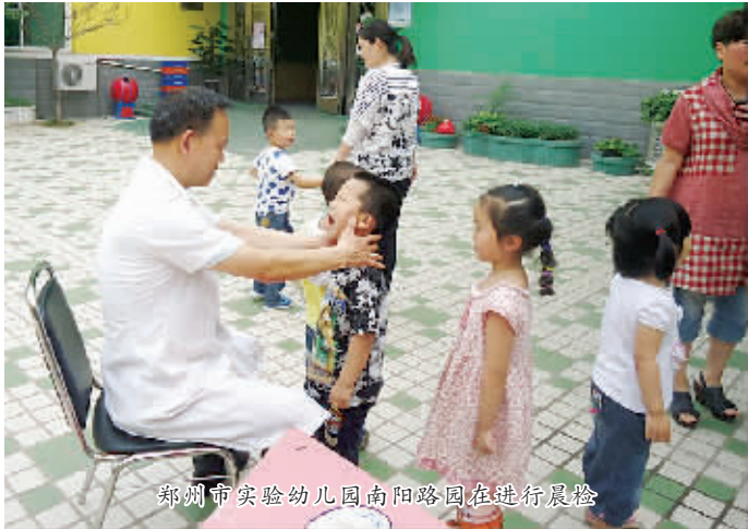
郑州市实验幼儿园南阳路园在进行晨检

检测显示: 5岁以下小儿,发病主力群体 郑州市疾病预防控制中心副主任医师王万民说,监测发现,郑州市手足口病疫情明显升高,患者主要集中在5岁以下,占93.6%;3岁以下占65.68%,城区发病较高。根据手足口病流行规律,下一阶段手足口病疫情可能会有进一步上升趋势。