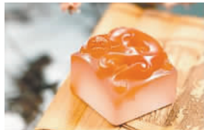
南红玛瑙——灵猴钮印章

在2012年北京博观当代玉雕精品秋季拍卖会中,北京博观将举办“王者归来——南红玛瑙雕刻艺术精品专场拍卖会”,上拍拍品60余件,以产自云南保山和四川凉山的南红为主,既有苏邦玉雕名家创作的以工艺见长的南红雕件,也有充分反映南红艳丽色彩、细腻材质的串饰,可谓精品汇聚,精彩纷呈,惊“红”一瞥,即将呈现。 (新浪收藏)