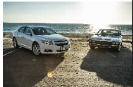
◆ Big Sur 大苏尔