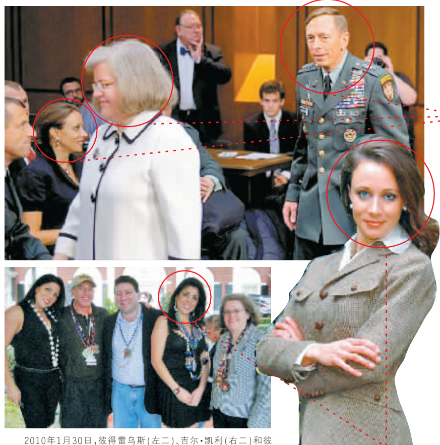
2010年1月30日，彼得雷乌斯(左二)、吉尔·凯利(右二)和彼得雷乌斯的夫人霍莉(右一)一同观看游行表演时的合影。