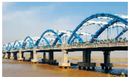
▲2006年10月通车的郑州黄河二桥,它是京港澳高速公路的重要组成部分。