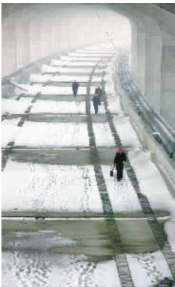
▲2009年11月的大雪,给郑新黄河大桥施工带来难度。

经济的腾飞离不开跨越江河的桥梁,多年来一座座黄河大桥投入建设并陆续开通,方便了黄河两岸人民经济、生活、文化的交流,带动了两岸的高速发展。