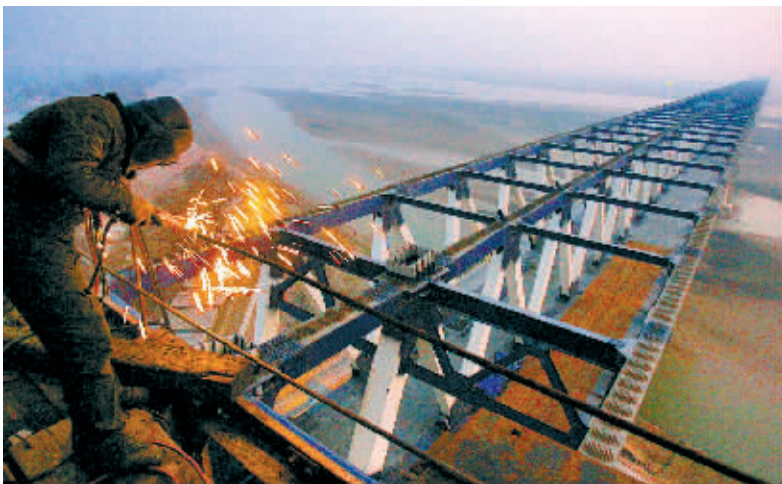
▲2009年12月19日,郑新黄河大桥钢结构合龙。