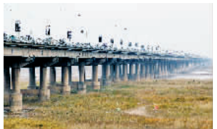
▲1986年建成通车的郑州黄河公路大桥已经取消了收费,真正成了黄河两岸的“连心桥”。