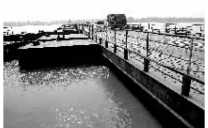
▲曾经,黄河浮桥是连接两岸的重要纽带。