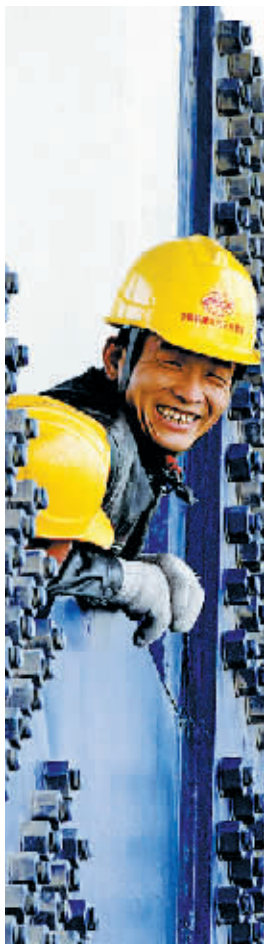
▲2012年11月12日,工人正在为郑新黄河大桥铁路进行高铁电气化调试,即将全部收工的工人高兴得笑起来。

11月12日,工人为郑新黄河大桥铁路进行高铁电气化调试,石武高铁进入试跑调试阶段,正式通行后郑州到北京仅需两个多小时。