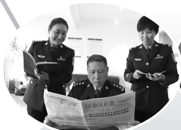
11月23日,安阳市公安局北关分局民警以科室为单位,深入学习党的十九届六中全会精神。民警表示,要把全会精神学深悟透,让全会精神入脑入心,指导实践、推动工作。

会议强调,要树好导向、强化引领,以全力争创全国法治政府建设示范市、精神文明建设水平上台阶、推动县级领导班子综合考核争先晋位为抓手,紧扣考核评价办法,推动局党组既定目标任务落到实处。要突出重点、抓住关键,瞄准中心工作、重点任务、关键要素,加强分析研判,着力补短板、强弱项、出亮点。要提升素质、改进作风,围绕司法行政“一个统筹、四大职能”,加强业务学习和实践历练;按照“13710”工作法、“周交办”和作风建设“10个关键词”工作要求,为全面推进现代化漯河建设提供坚强法治保障和优质高效法律服务。(许乐)