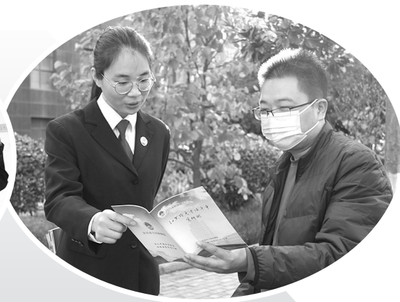
长葛市检察院注重用学习党的十九届六中全会精神成果推进各项工作。图为该院检察官走上街头进行宣传,让更多群众了解常态化开展扫黑除恶专项斗争的重要性和必要性。