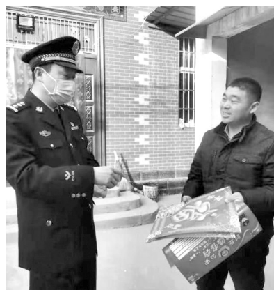
春节前夕,封丘县公安局民警以“平安守护”专项行动为载体,开展反诈送福进农家活动,将“福”字和对联等送到群众手中,受到群众好评。

周东柯要求,各单位要坚持守土有责、守土尽责,进一步强化应急指挥体系建设,建立健全工作专班,加强值班值守,严格执行“日报告”“零报告”制度,特别要发挥好基层党组织的战斗堡垒作用,着力提高做群众工作的能力,在全县形成群防群控的硬核力量;抓实交通运输、治安管理等领域风险管控,坚决守牢疫情防控阵地,履职尽责,确保全县人民度过祥和、平安、幸福的春节假期。(张伯特)