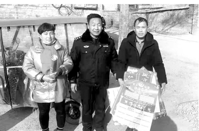
春节前夕,封丘县公安局荆隆宫派出所民警在“平安守护”专项行动中,为群众送上印有防诈骗提示语的新春挂历。