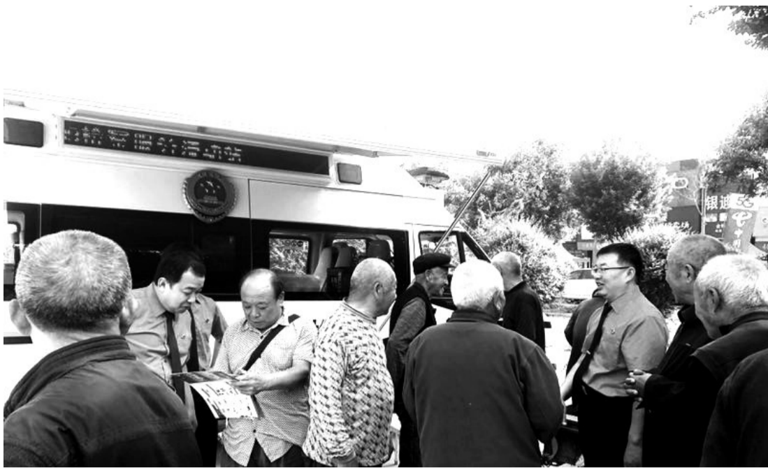
法治宣传车开到群众家门口