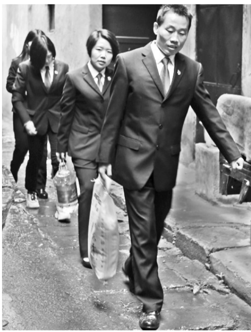
◀ 4月13日,气温骤降,阴雨连绵。许昌市魏都区法院干警走进魏都区五一一路办事处碾上社区,为10户困难群众送去了米、面、油等生活用品,把党的温暖关怀送到困难群众的心坎上。