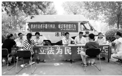
执行干警宣传法律