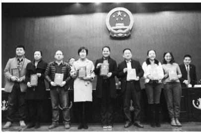
省法院为新闻媒体颁发“执行贡献奖”