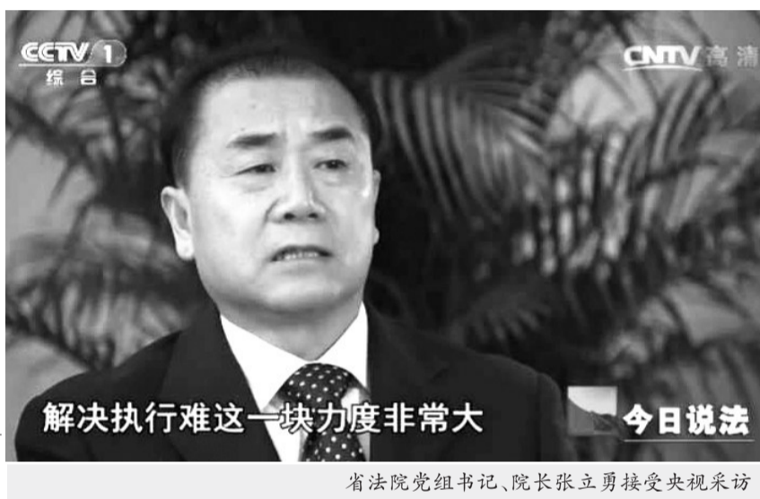
省法院党组书记、院长张立勇接受央视采访

“执行宣传工作是执行工作的重要组成部分，全省各级法院党组务必要高度重视，始终把宣传工作与其他执行工作同部署、同检查、同落实。”这是省法院党组书记、院长张立勇在2016年5月26日召开的全省法院向执行难宣战誓师大会上提出的明确要求。 一年多来，在省法院的组织和指导下，全省法院多措并举，大力开展执行宣传工作，掀起了一浪高过一浪的宣传热潮，为基本解决执行难营造了良好的舆论环境。