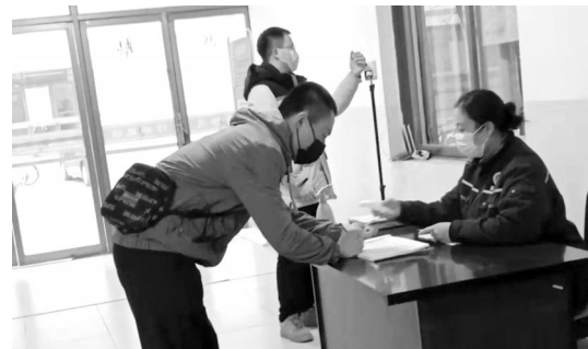
河南一高校对学生宿舍进行出入登记管理