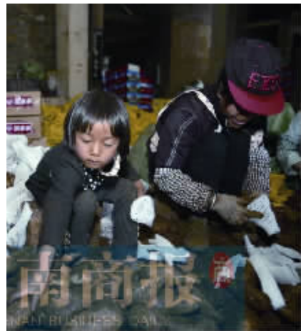
帮助贫困地区,拼多多一直在努力