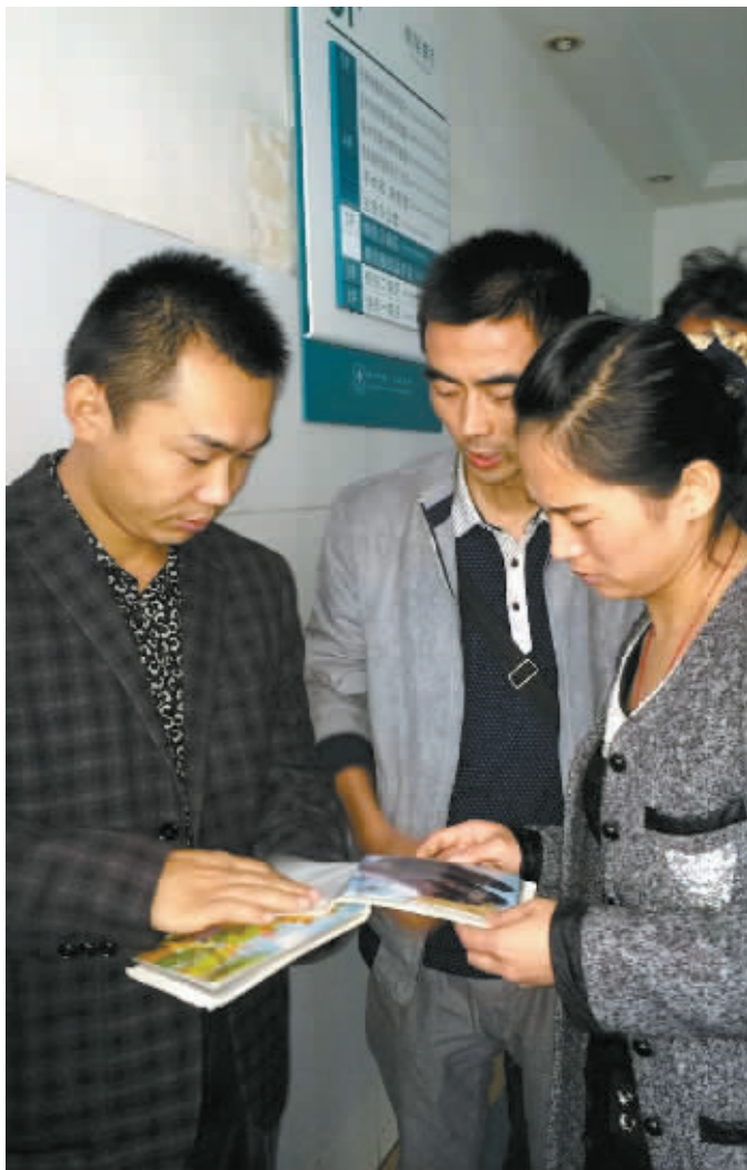
商报曾经报道过的面具女孩的爸爸(左)为妞妞家人支招