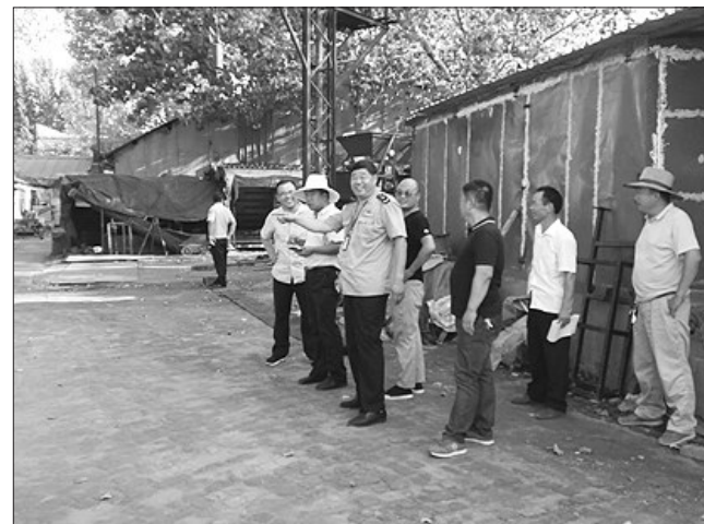
近日,临颍县工商质监局组织辖区内的中小企业污染情况进行逐户排查,环境污染治理工作取得明显成效。

5月10日,泌阳县工商质监局组织开展创建国家有机产品认证示范区企业申请认证签约仪式,杭州万泰认证有限公司与泌阳县10家合作社签订了有机产品认证协议。此次签约提高了泌阳县有机产品的市场竞争力,将泌阳县的生态优势很好地转化为经济优势,实现了农业增效和农民增收。(杨辉)