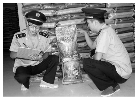
“三秋”即至,台前县工商局开展秋季农资打假专项行动,通过农资经营主体清查,强化农资商品质量抽检,严防假冒伪劣种子、化肥坑农害农事件的发生。