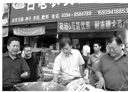
秋收冬种之际,为净化农资市场,周口市工商局开展了“红盾护农”专项行动,组织督查组深入农资市场现场检查农资经营户证照办理以及承诺书签订等情况,杜绝不合格农资流入市场。