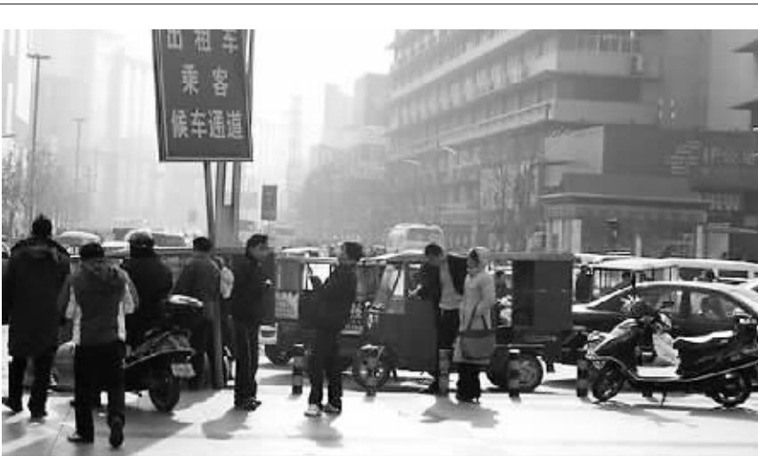
题为网友“郑州的哥”拍摄的郑州火车站“黑车”乱象

《郑开大道开通三周年 网友：跑动的是车 流动的是经济》 2009年11月19日 《网友热议奇瑞汽车落户中原》 2009年9月1日 《郑汴将在“轨道”上奔跑》2008年3月13日 更多>>>>>>