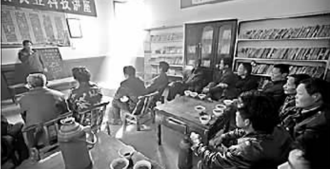
品茶,读报,听戏,学农业科技,邓州市城乡文化茶馆里真是热闹。春日,记者在这里拍到了一组镜头。邓州茶馆起源于明清年间,是当地人品茶消遣的地方。从2005年以来,该市采取政府补贴,有关部门扶持的办法,为茶馆配备了图书、文体器材、远程教育网络终端等文化设施,通过把文化与茶馆嫁接,改造、新建文化茶馆512个。如今,这里的茶馆文化更浓了,农民们在品茶的同时还学到了新技术、新知识。③3 ▲张楼乡茶庵村的文化茶馆里正在演出文艺节目。 ▲白牛乡的农业科技讲座正在白西村文化茶馆举办,农民们边品茶边学习农业科技。