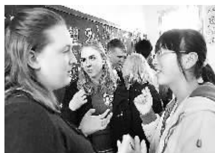
3月18日,美国堪萨斯州蓝星中学代表团来到开封市第五中学,开始为期一周的交流学习活动。7名美国学生与7名中国学生结成对子,他们将同吃、同住、同学习,体验中国学生的学习和家庭生活。③3

本报讯(记者吕广鹏 通讯员赵增增)“政府出资,行政村出地,农民出力,体育部门配置器材”——3月18日,记者从新乡市有关部门获悉,该市将出资150万元,为500个行政村配置3000个购置室外篮球架一副,各行政村根据自身实际情况自建篮球场。随着北京奥运会的临近,全市掀起了一股运动健身的热潮。政府此次出资兴建篮球场,正是为了解决农村体育场所、器材缺乏的问题。”据该市体育部门负责人介绍,除了在农村新建篮球场,该市还要主办许多以“全民健身与奥运同行”为主题的活动,进一步激发群众健身热情,加快推广普及全民健身知识,广泛开展群众体育活动。②9