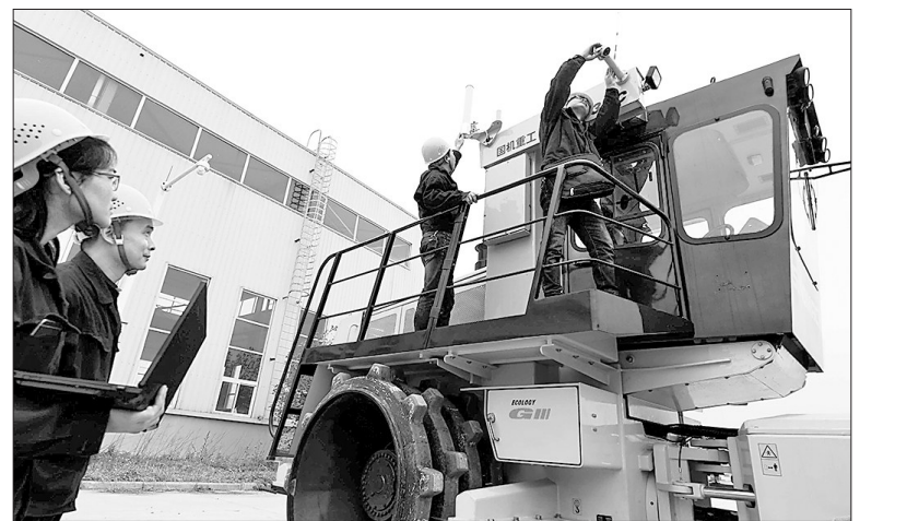
5月2日，在国机重工(洛阳)有限公司，工作人员正对最新研制的第二代无人驾驶智能遥控环卫车进行测试。③3

青春不息，奋斗不止。河南共青团将以习近平新时代中国特色社会主义思想为指引，紧密团结在以习近平总书记为核心的党中央周围，不忘初心、牢记使命，团结带领全省广大团员青年勇毅走在时代前列的奋进者、开拓者、奉献者，在谱写中原更加出彩新篇章中贡献青春智慧和力量！③6