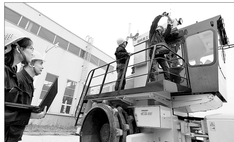
5月2日,在国机重工(洛阳)有限公司,工作人员正对最新研制的第二代无人驾驶智能遥控环卫车进行测试。③3

三年转瞬即逝,攻坚时不我待。深入贯彻习近平总书记扶贫开发重要战略思想,以总攻的状态、决战的态度、必胜的心态,苦干实干、持续发力,河南一定能在实现中华民族伟大复兴中国梦的征程中更加出彩! ③6