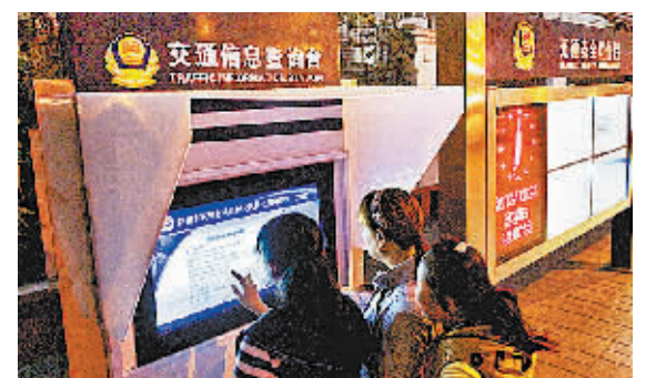
10月27日,洛阳市民在街头“交通信息查询台”前查询相关信息。近日,洛阳市“交通信息查询台”系统亮相洛阳交警高新交巡滨河岗,市民不用进交警大队,就可“智能交警”电子触摸屏时查询车辆违章记录、交通违法行为等信息。③3

余亩国内最大抗菌肽生物产业园,做抗菌肽行业的领导者。”中农颐泰公司董事长郭文江说。其实,像中农颐泰这样的高科技项目,产业集聚区还有许多:林州科能材料公司与中科院过程工程研究所合作引进国家973计划成果,建成了国内第一家功能化离子液及电解液研发中心,年产100吨离子液项目建成投产;宏创能源科技公司年产100万套LED高分辨率产品投放市场……就在记者采访期间,光远新材料公司年产10万吨电子级玻纤项目点火投产了,该项目不仅世界领先,而且填补了我省在池卷拉丝玻纤行业的空白。“高端制造业和高新技术已成为林州产业集聚区快速发展的两个引擎,推动产业集聚区加速发展。”林州市市长王军说。③7