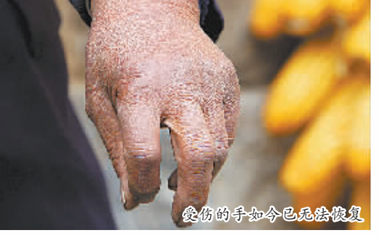
受伤的手如今已无法恢复