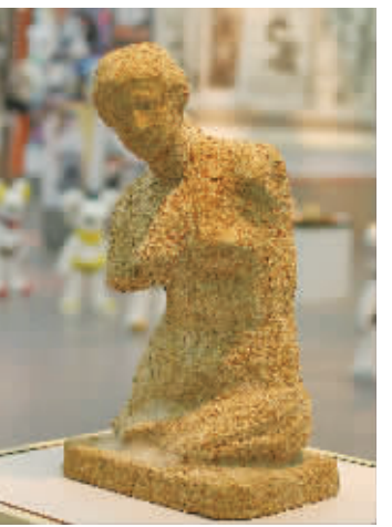
熊猫大便做成的维纳斯 成都的孩子 指导老师:朱成