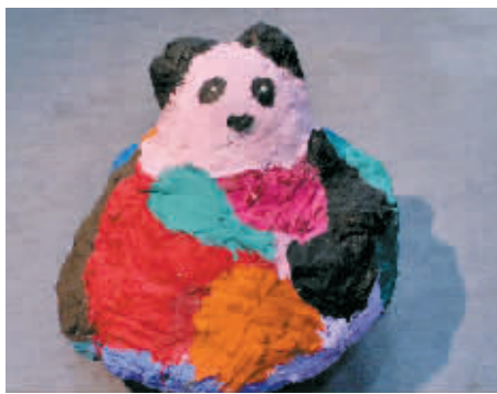
熊猫莹莹 集体创作 指导老师:周鹏