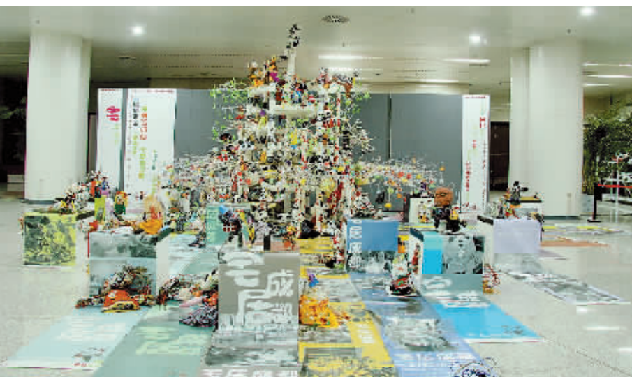
宅居成都(布、毛线、卡纸等综合材料) 成都少年宫美术学校学生集体创作 指导老师:左志丹 闫华 刘玉林 岳玓 骆平 安妮 彭媛 车国涛 蒋锐 李丹