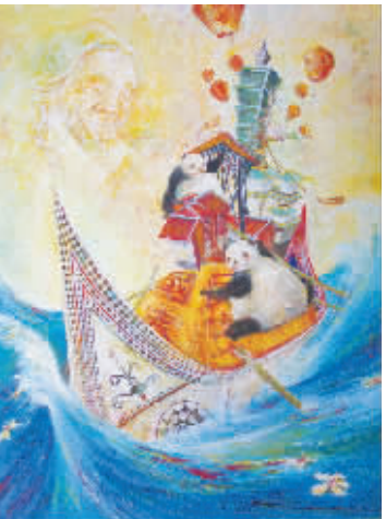
多元的台湾,多元的爱 台中第一高级中学 口路玉琴