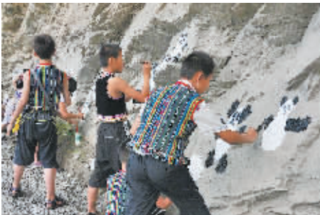
熊猫岩画 四川都江堰少年宫的孩子