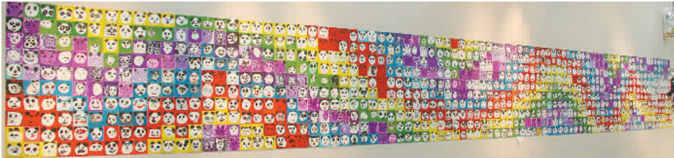
一千个表情 5-7岁的一千个孩子 指导老师:郑州西雨艺术中心全体基础阶段老师