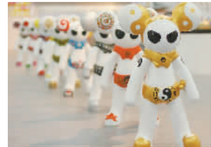
暴力熊猫 集体创作 指导老师:唐立雯