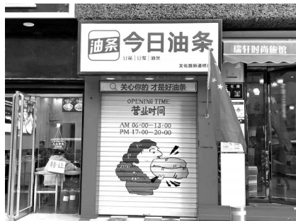
今日油条早餐店门头设计酷似App今日头条

“今日油条”上了今日头条，还被今日头条给告了。近日，河南省郑州市的一家名为“今日油条”的餐饮企业，被今日头条运营主体公司字节跳动诉上法庭，一时间，这一消息成了网友热议的话题。这家与今日头条名字只有一字之差的餐饮店，是否涉嫌商标侵权？酷似今日头条的门店海报及价目表设计，是否构成不正当竞争中的“混淆行为”？针对上述问题目前尚无定论，有待法院作出裁判。