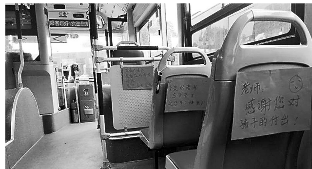
公交车座椅上写给老师的祝福

当车辆行驶到绿城小学丰庆路博颂路站后,一名小学生举起一张自己填写有教师节祝福语的卡纸,向上车的乘客展示,并高兴地把它带走准备送给自己的老师。