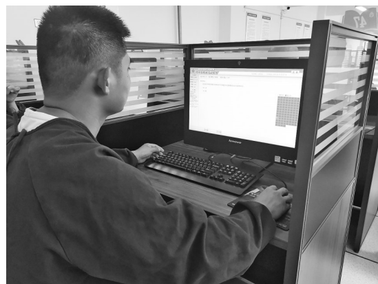
一名考生正在答题