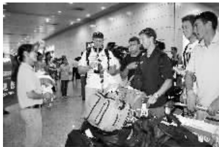
参赛选手陆续抵郑